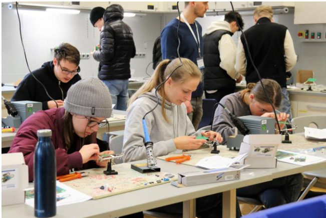
Abbildung 1: Konzentrierte Schülerinnen und Schüler beim Löten der Alarmanlage