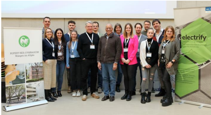
Abbildung 3: Das engagierte Betreuungs- und Organisationsteam von AVL SET und RNG