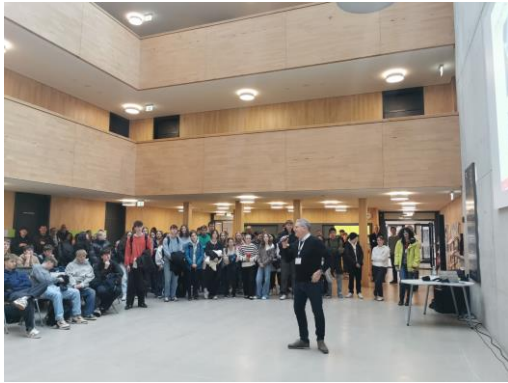
Abbildung 3: Die Schüler*innen des RNG waren von den Einblicken in die Elektrotechnik begeistert